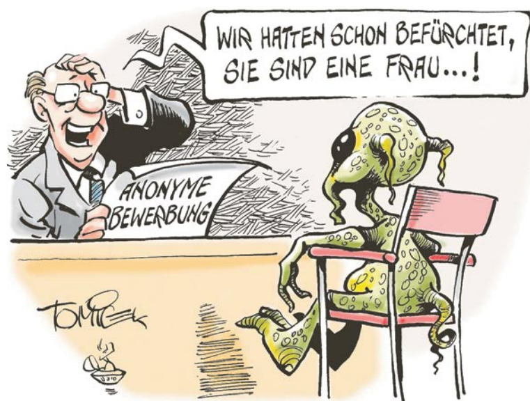
Anonyme Bewerbungen erhöhen die Chancengleichheit!